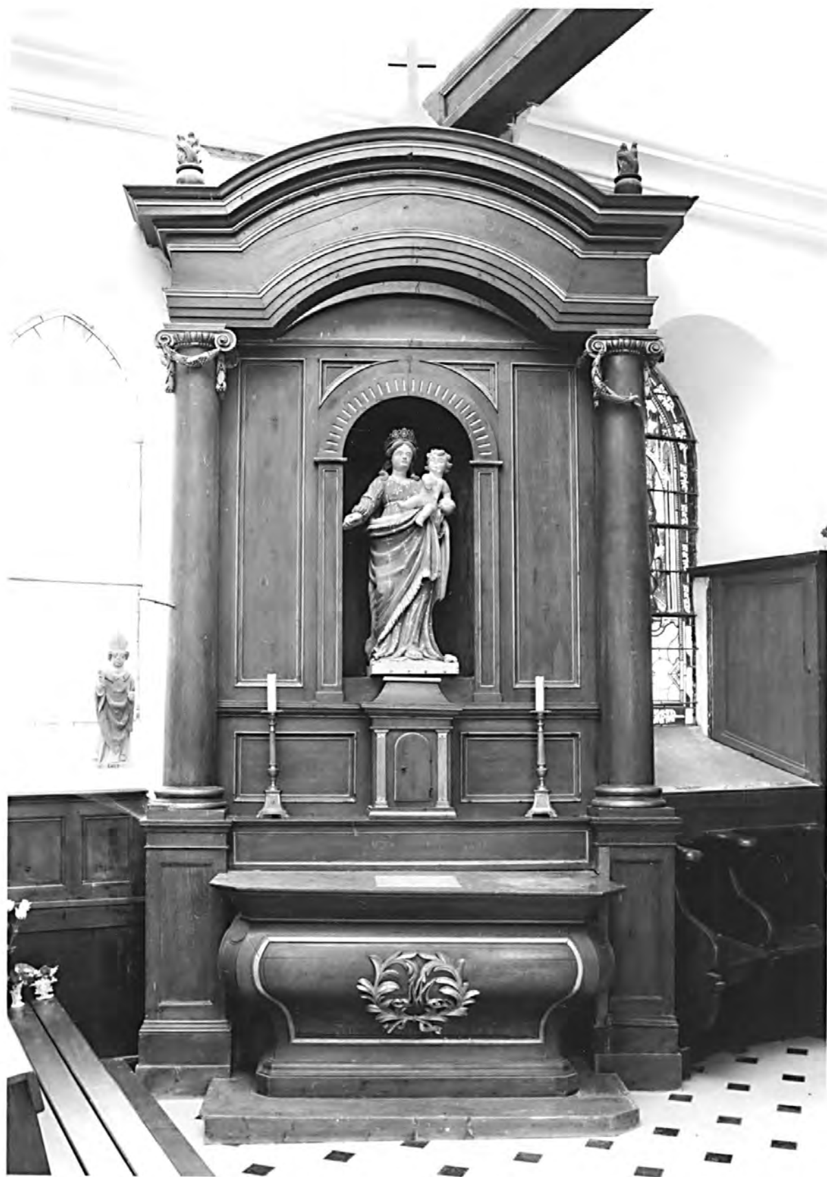
Ensemble de l'autel secondaire nord