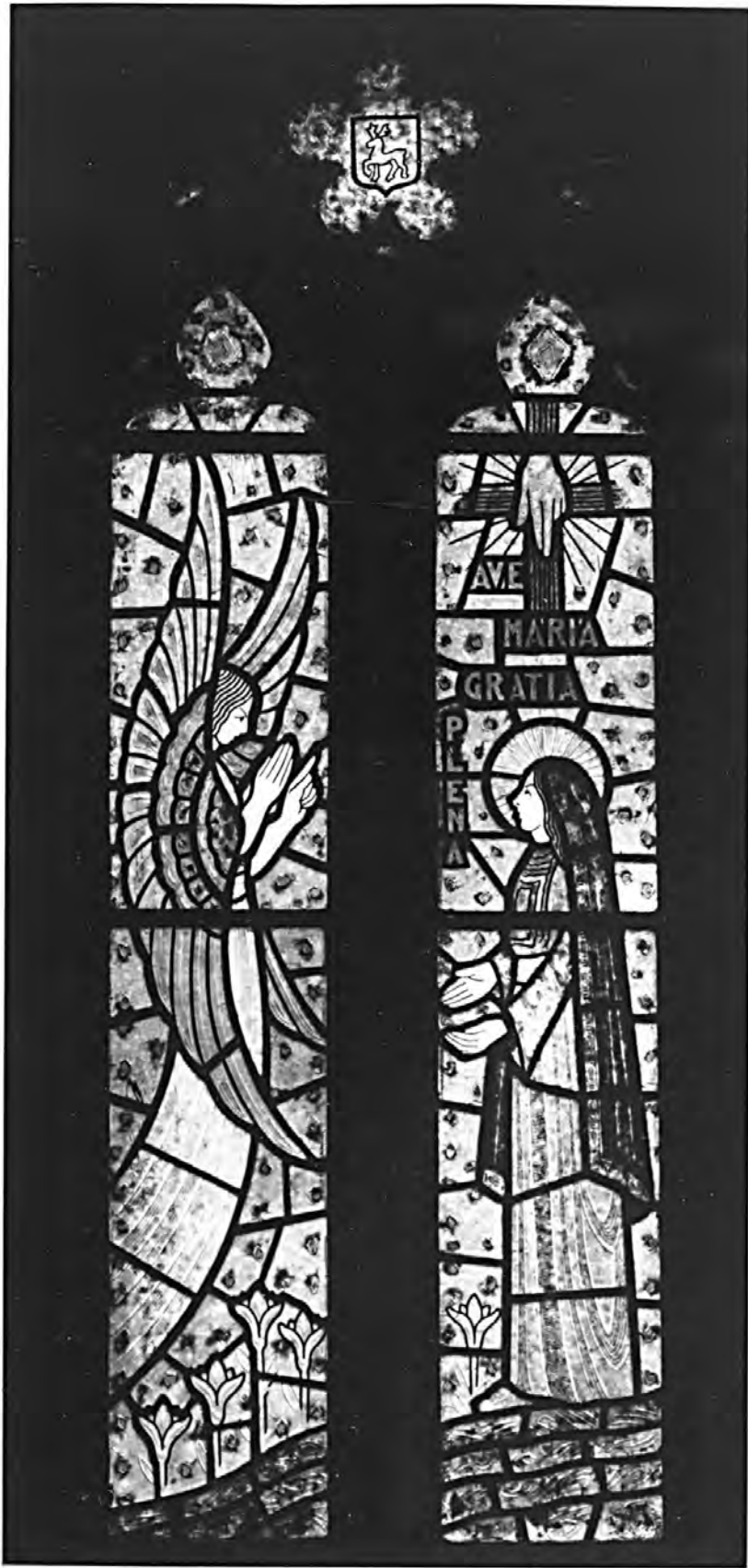
vue d'ensemble Baie 5 : Annonciation