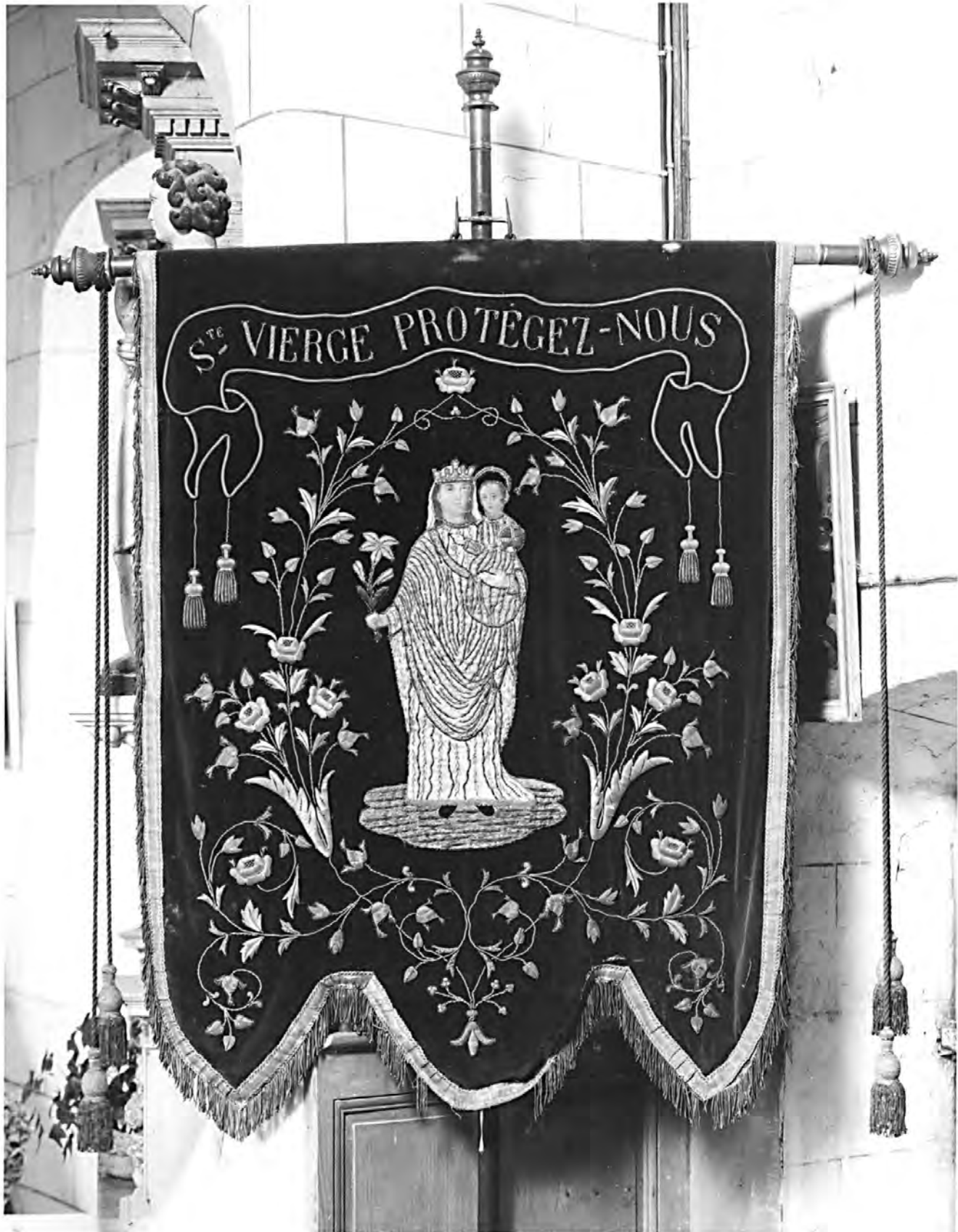
Bannière de procession, face : Vierge à l'Enfant, inv. n°10