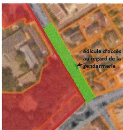
Détail du périmètre de protection : emprise du réseau hydraulique situé sous la chaussée et les trottoirs de l'avenue de Villeroy et édicule d'accès au regard situé près de la gendarmerie