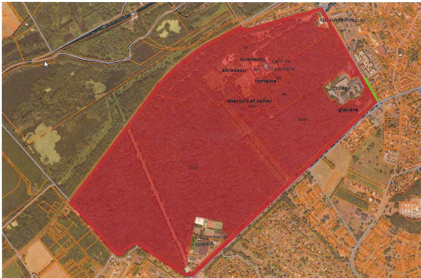
Périmètre de protection au titre des monuments historiques

Plans annexés à l'arrêté n°IDF-2022-B-01-08045 portant inscription au titre des monuments historiques du parc de Villeroy, situé avenue de Villeroy et boulevard Charles-de-Gaulle à Mennecey (Essonne)