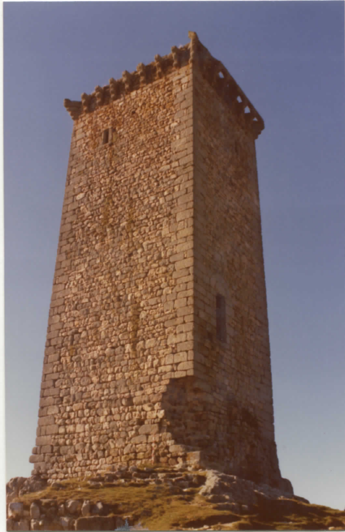
face nord-est de la tour