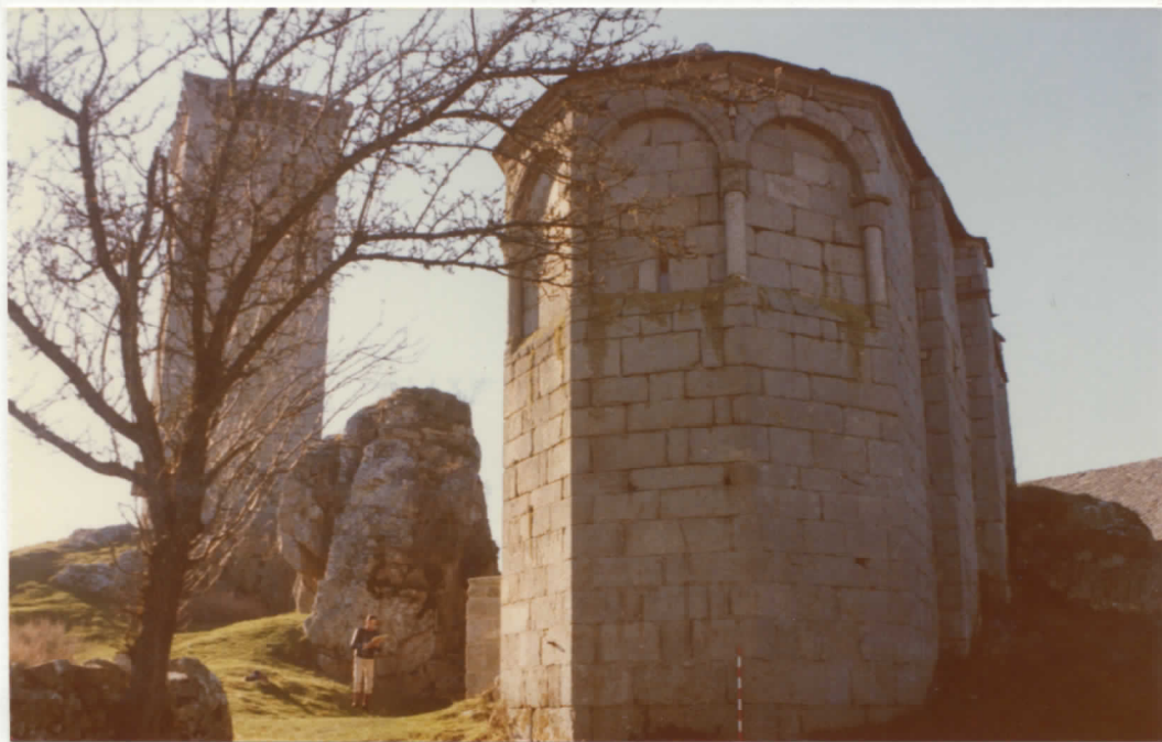
abside pentagonale Est de l'église.