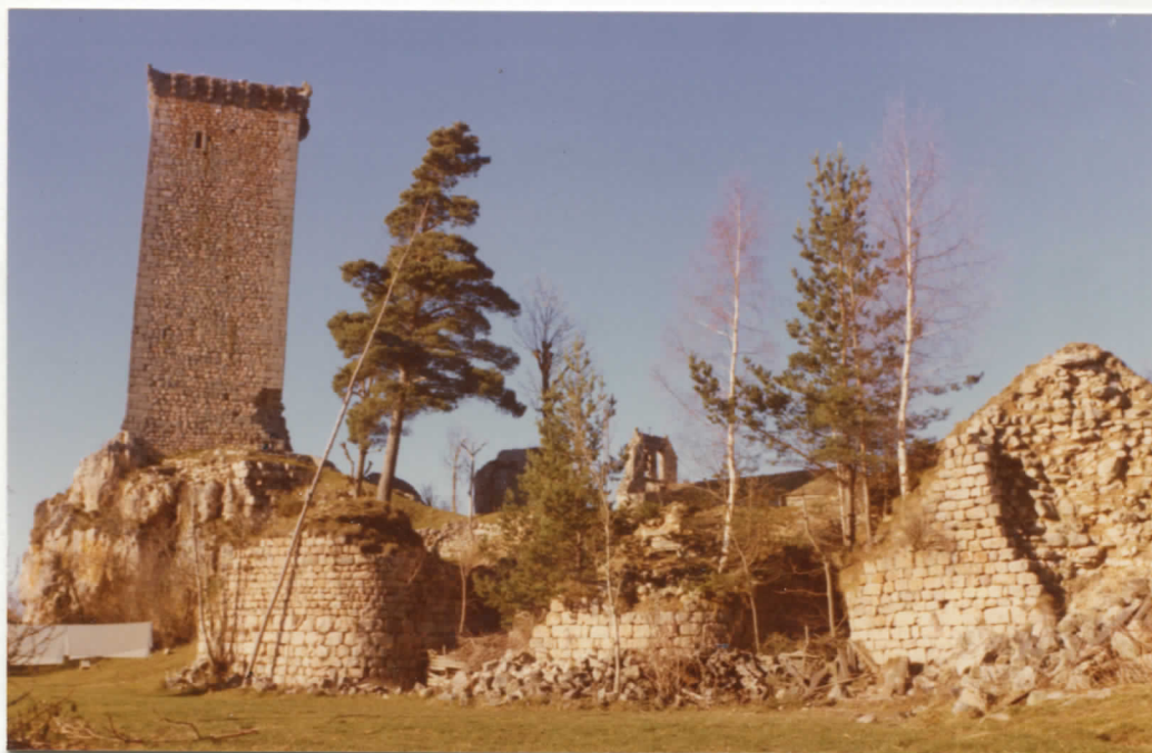
vue d'ensemble sud du village.