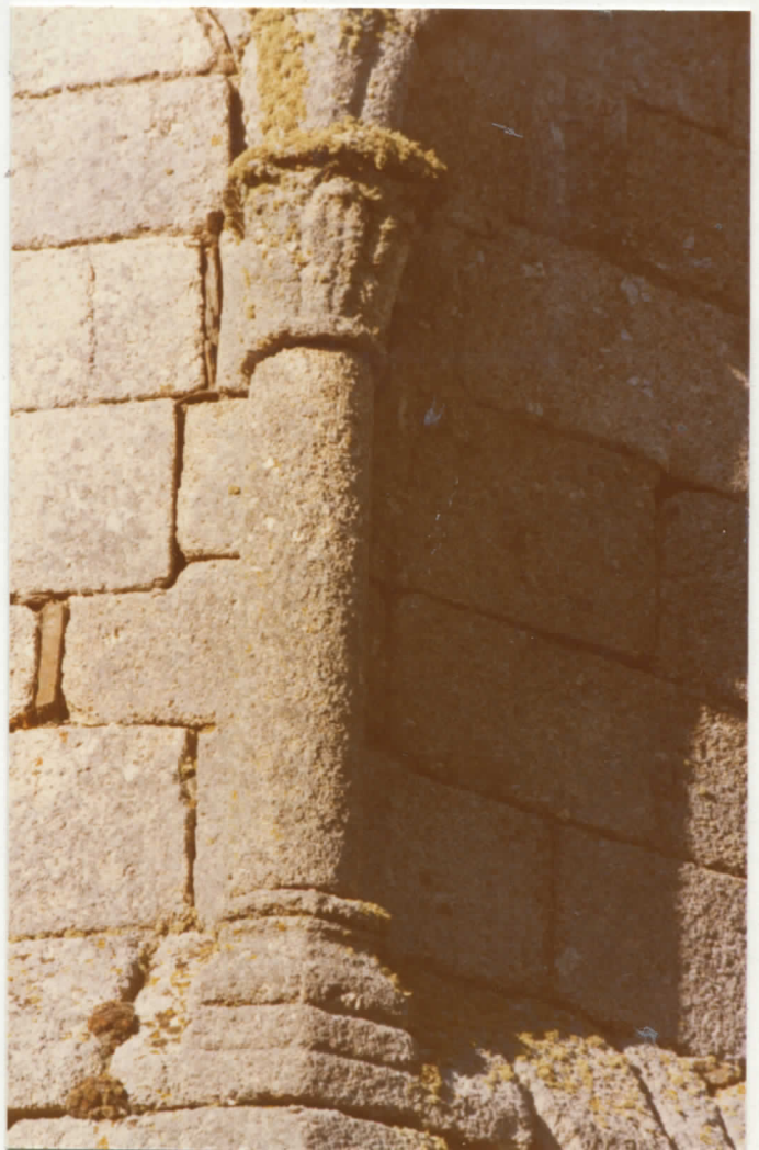
colonnnette d'arcature de l'abside, côté sud.