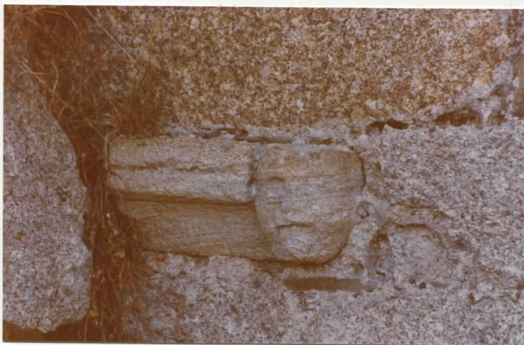
Tête sculptée dans un bloc remployé dans le mur sud à gauche du portail d'entrée.