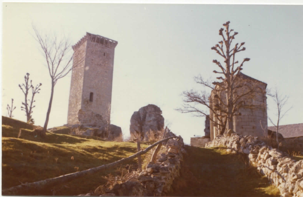
face nord de la tour l'abside de la chapelle orientée Est.