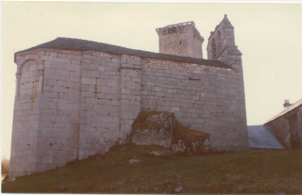
Côté nord de l'église