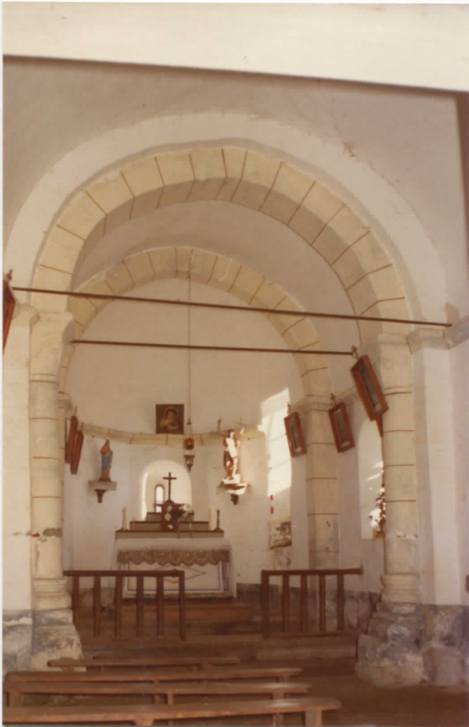
intérieur de l'église: vue vers le choeur