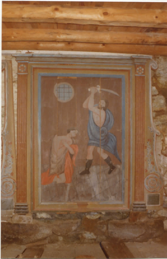
ancien retable démonté; peinture sur bois à la détrempe "la décollation de Saint Jean-Baptiste"