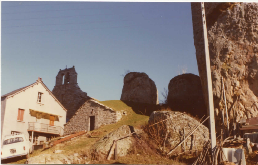
vue d'ensemble côté ouest: clocher et au centre une pièce voûtée appartenant probablement au château.