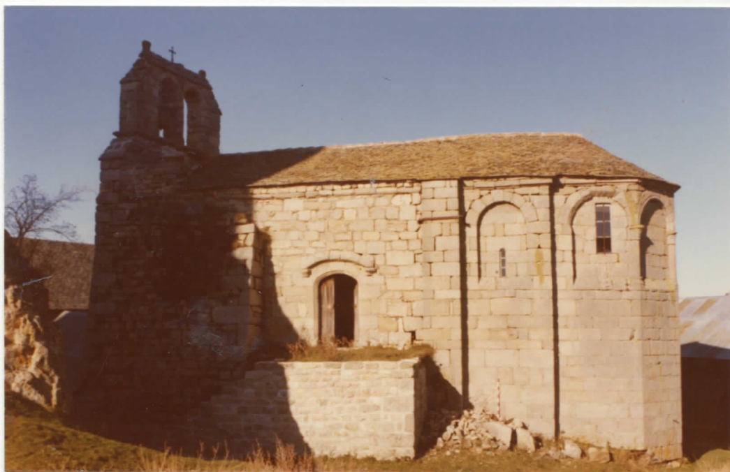
côté sud où s'ouvre le portail d'entrée de la chapelle.