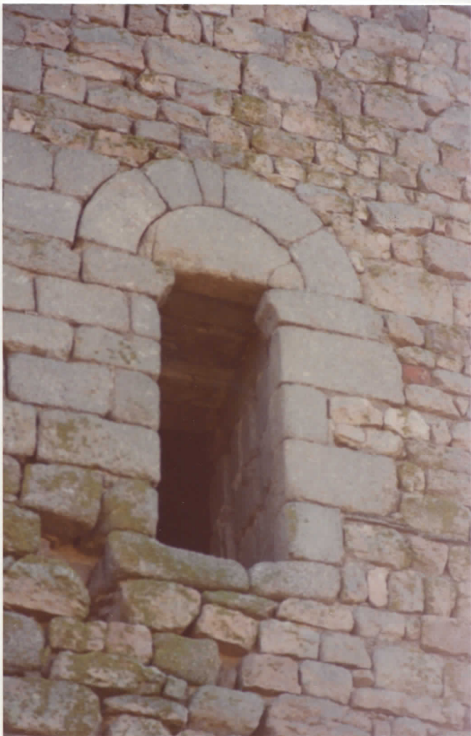
porte de la tour sur le côté nord.