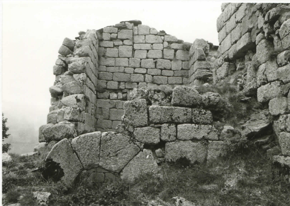
tour ouest, vue du corps central : vestiges de l'arc appareillé de la porte