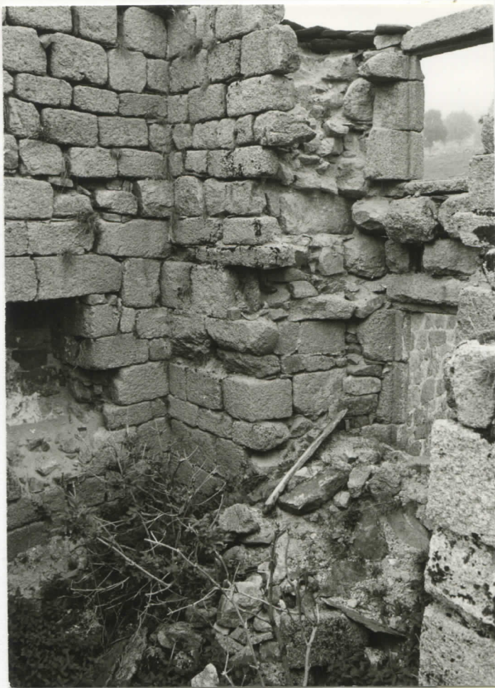
intérieur de la tour ouest : angle nord-ouest