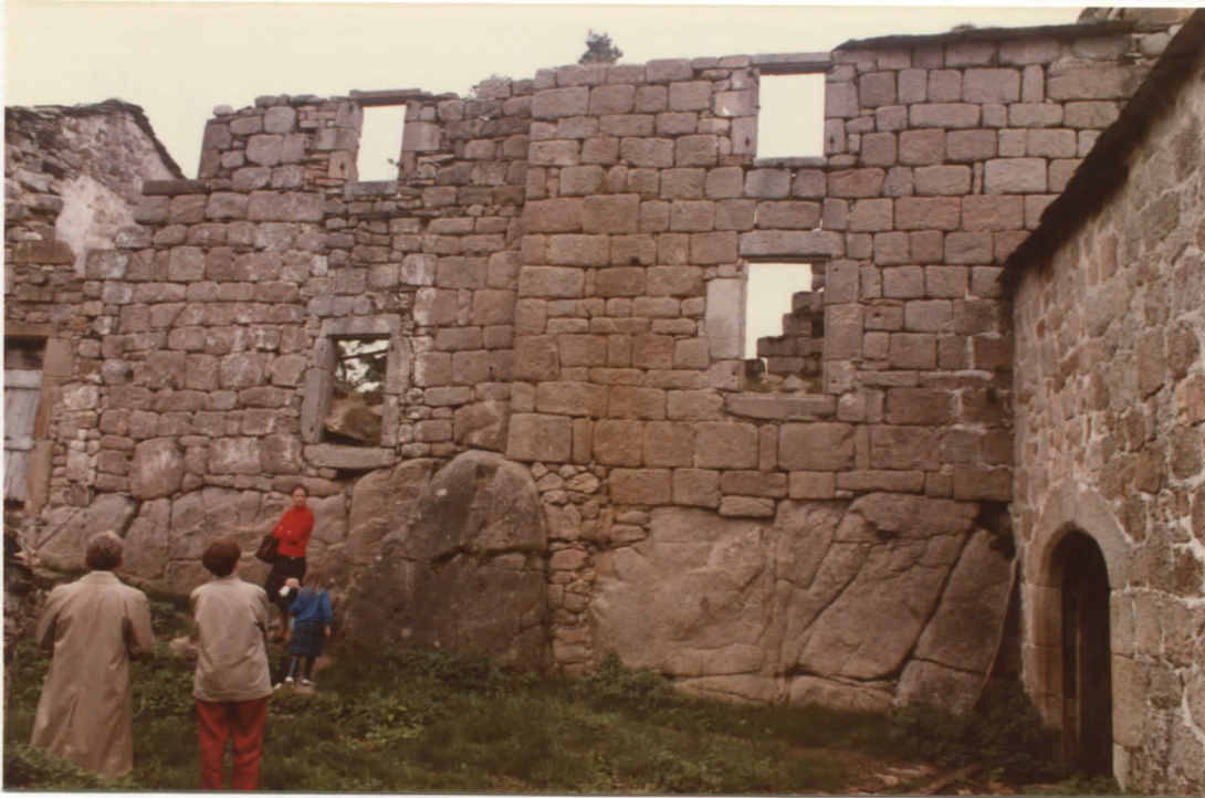
Corps central et tour ouest / façade nord