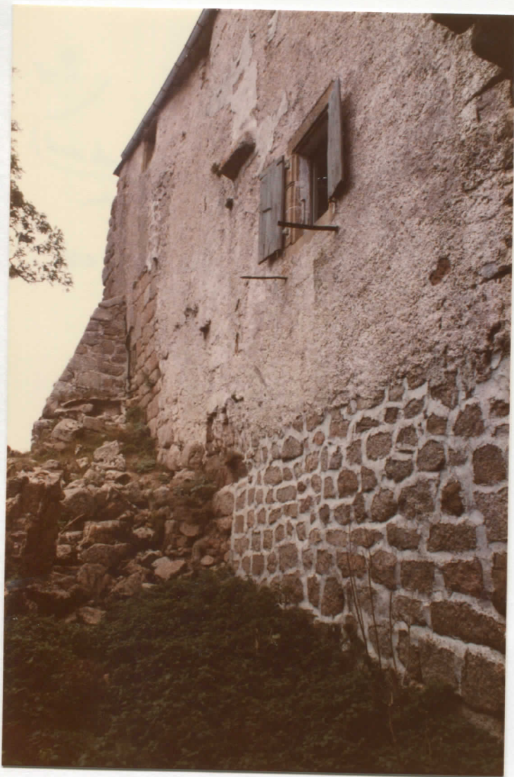
massif est, façade sud, vue prise du sud-est