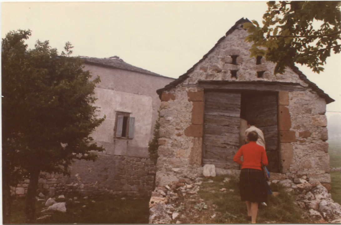
grange est (isolée) : façade est