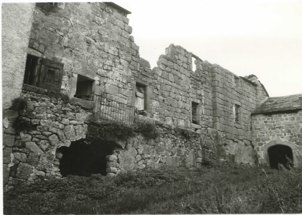
corps central, cour ouest et façade nord