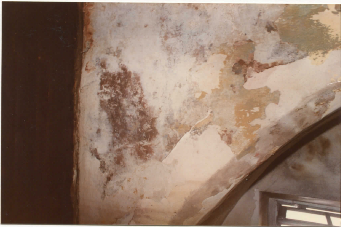
détail de l'arc