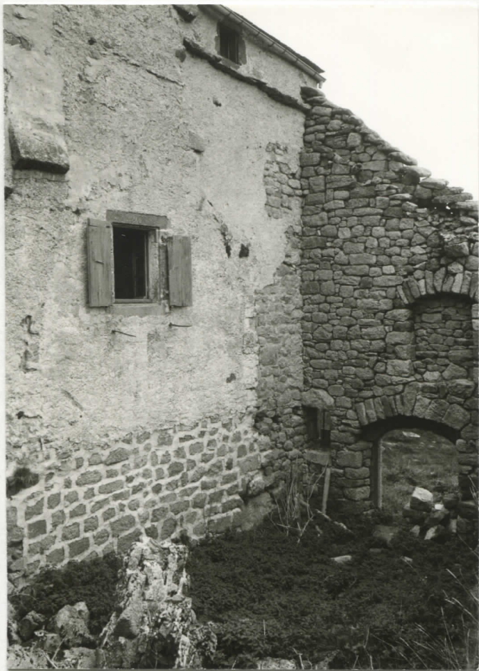
massif est, façade sud et angle nord-est