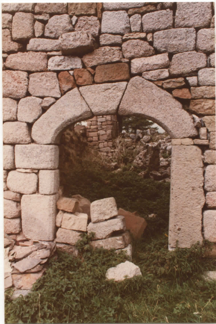
massif est. mur accolé au sud / portail appareillé