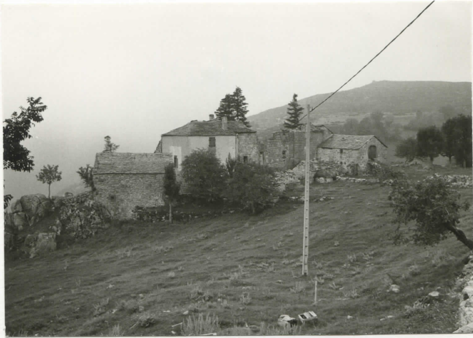
vue d'ensemble prise du nord-est