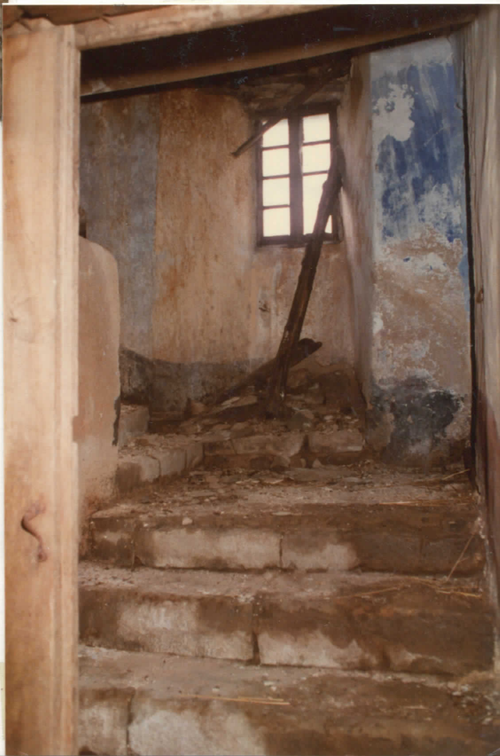
massif est : intérieur | escalier