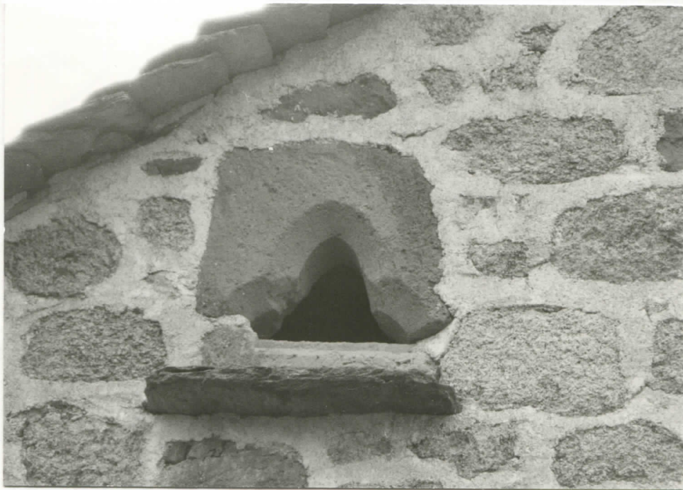
remplis d'élément de baie-trilobée