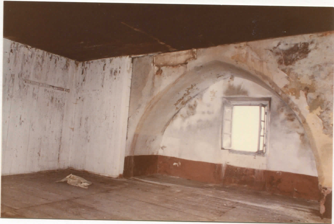
massif est : 2ème niveau