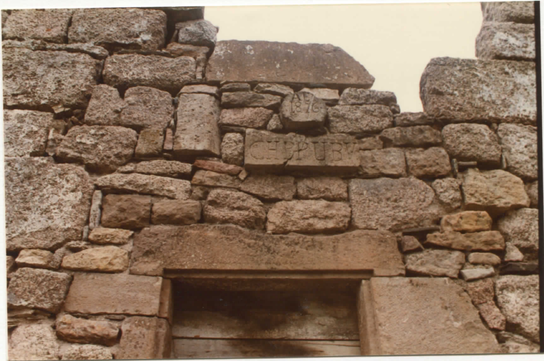
corps central , façade nord - inscription au-dessus de la porte