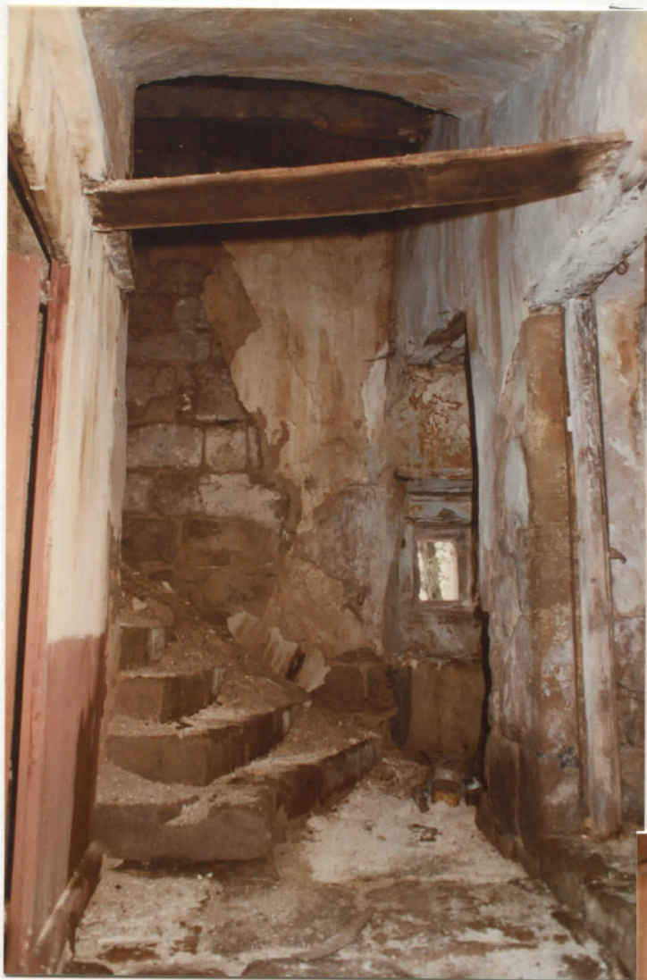
massif est : intérieur (1er niveau) départ d'escalier