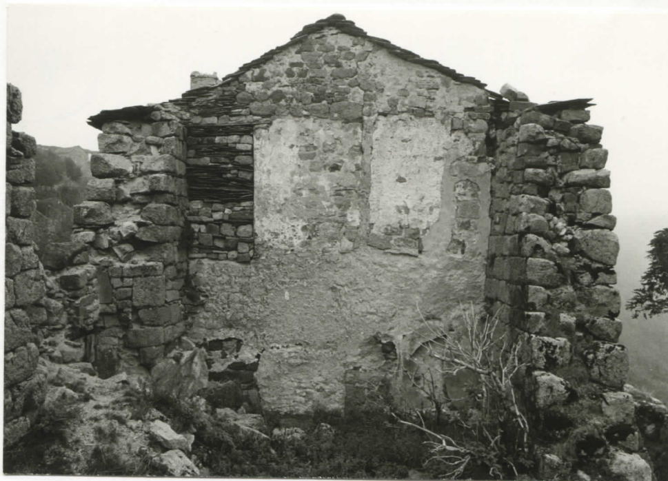
intérieur du corps central et massif est (vu de l'ouest)