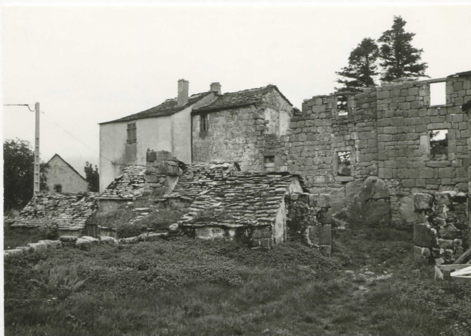
vue prise du chemin d'accès/cour nord, au premier plan les petits bâtiments entourant la cour