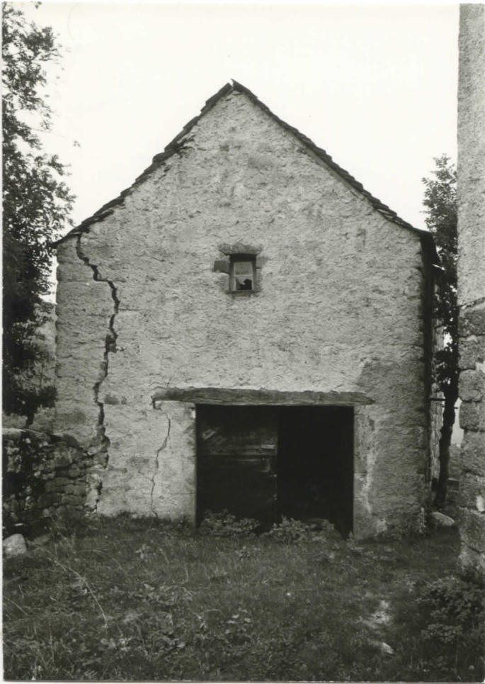
grange est : façade ouest