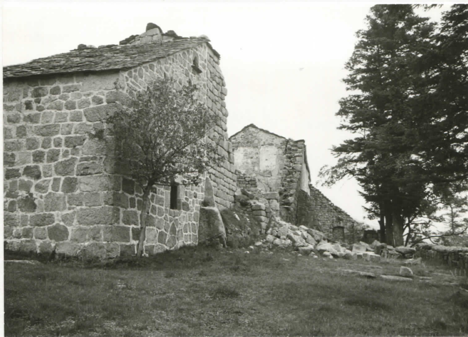
vue d'ensemble prise du sud-ouest depuis la terrasse sud