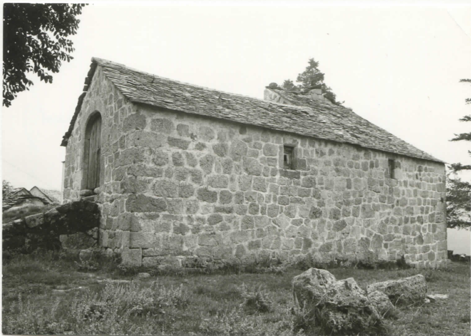
grange ouest (façade ouest)