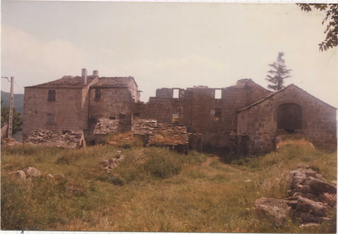
façade nord après décapage du corps de bâtiment est.