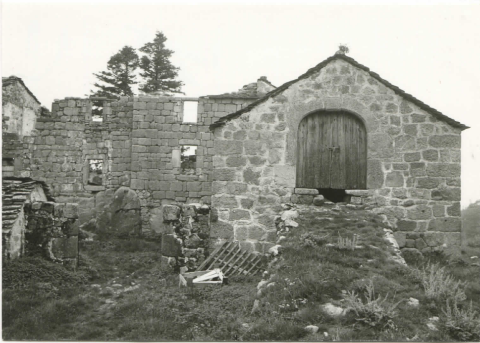
corps central, cour ouest et grange ouest- (nord)