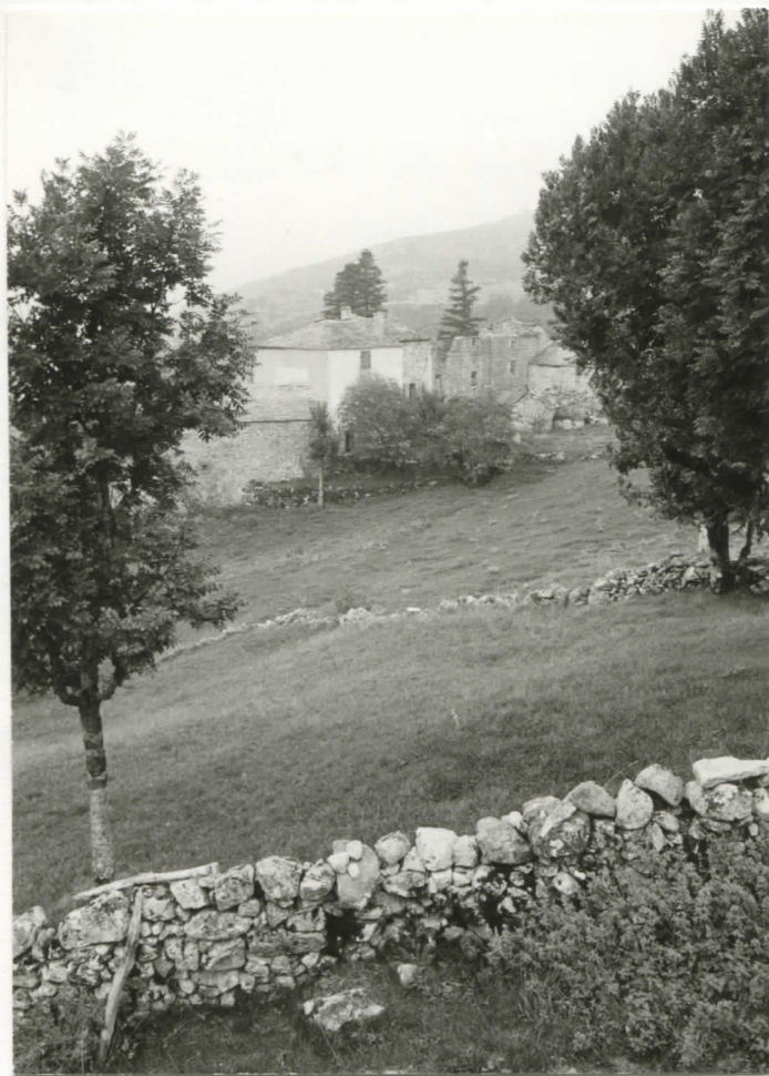
vue d'ensemble prise du nord-ouest Eik