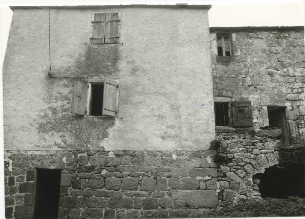
1 e corps est / façade nord