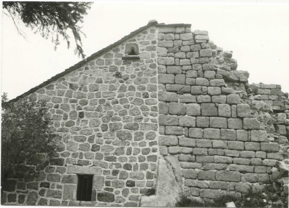
l'arrière de la grange et la tour-ouest, façade sud