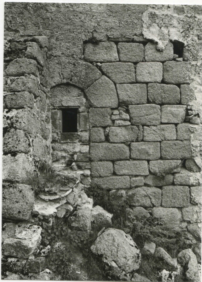
massif est, façade sud : premier niveau, angle sud-ouest avec porte murée