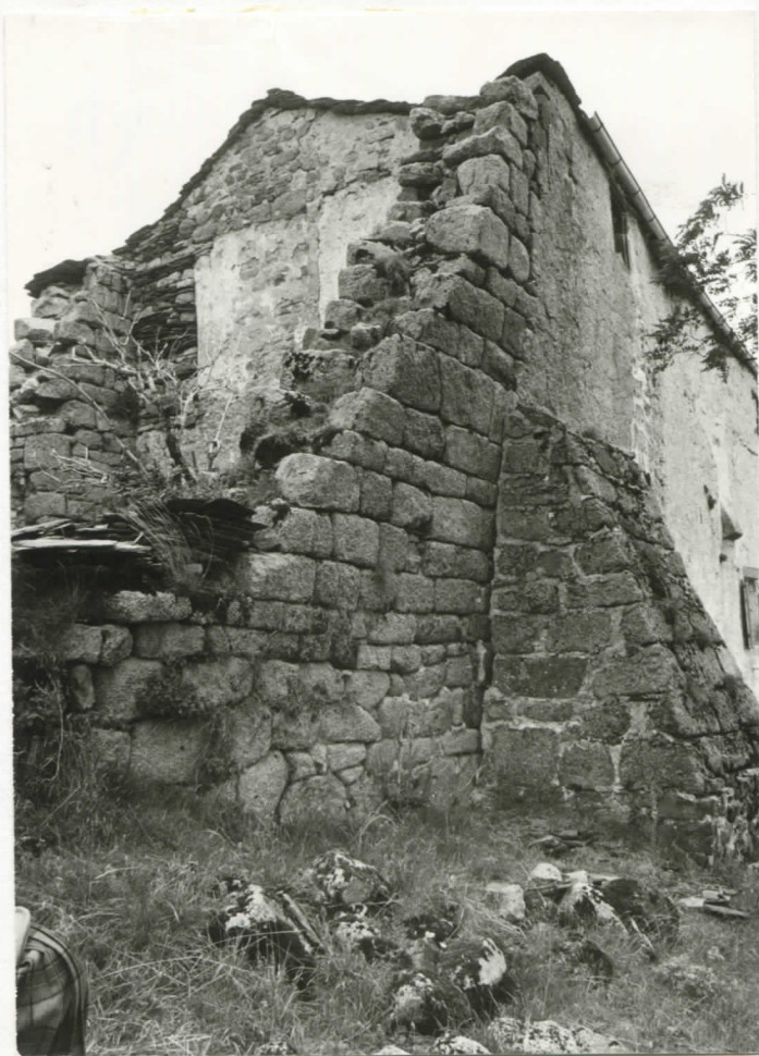
corps central et massif est (sud)