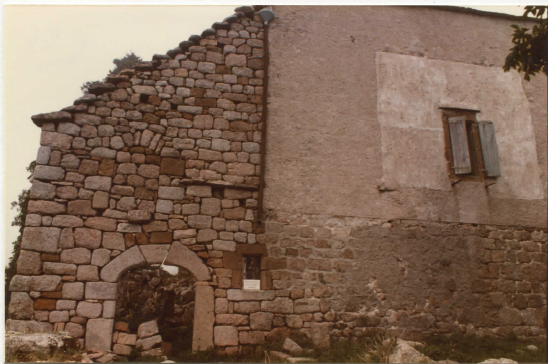
massif est : façade est