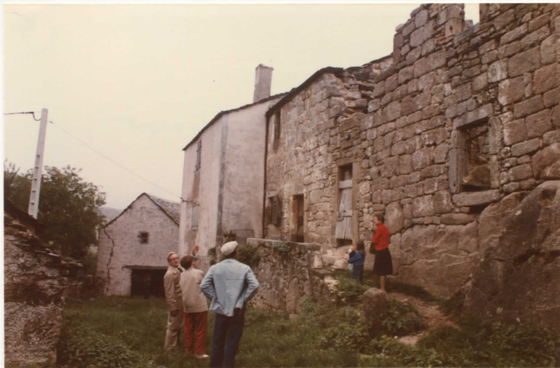
vue prise du nord-ouest (depuis la cour) le corps central, le corps est et la grange est isolée