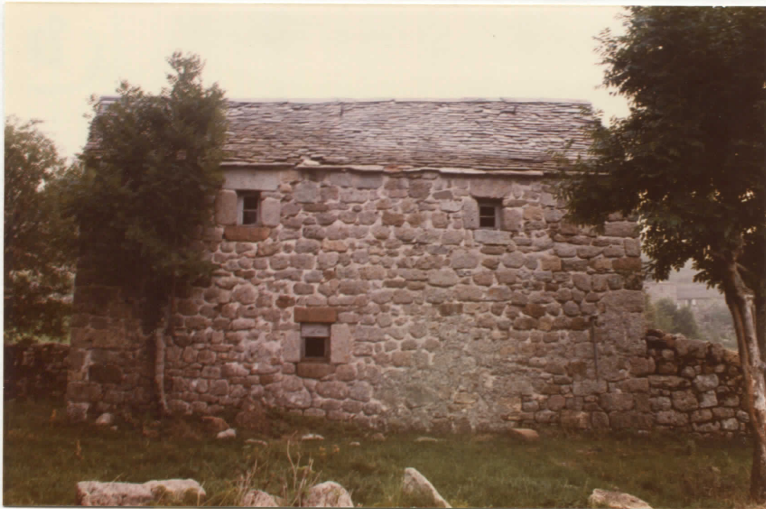
grange est : façade sud