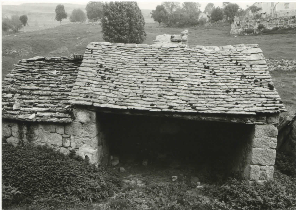
petits bâtiments de la cour nord