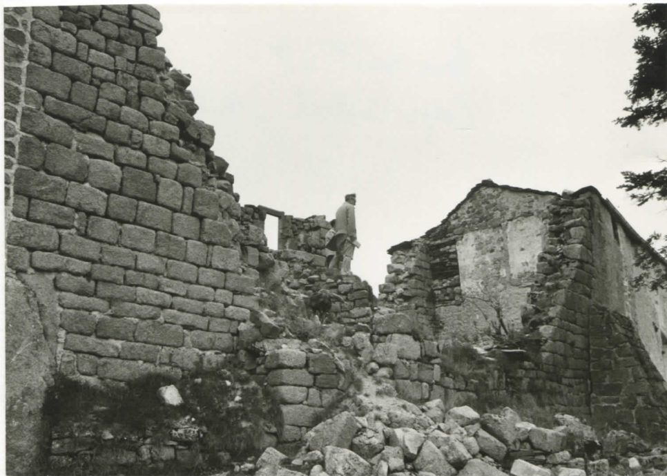
tour ouest et corps central, sud