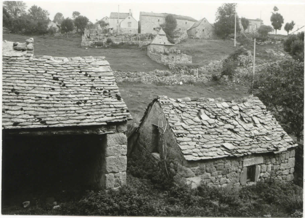
petits bâtiments ceinturent la cour nord (au fond, le hameau)