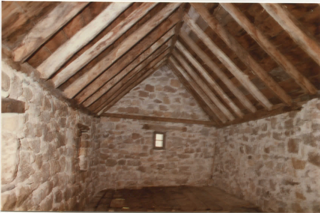
grange est : intérieur niveau supérieur vu vers l'ouest