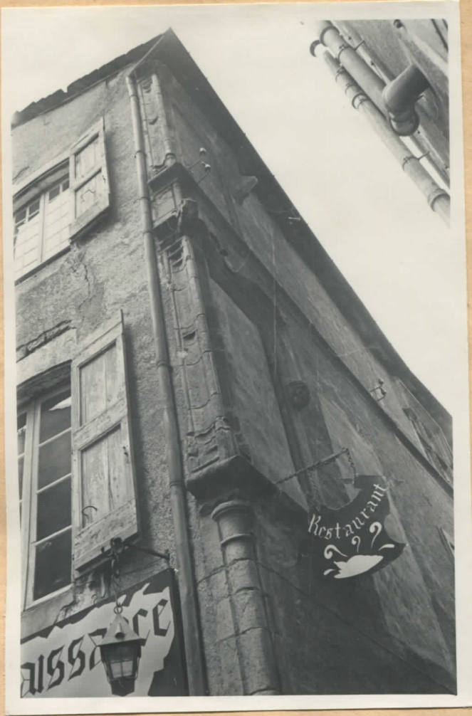
Fig.4: Fenêtre d' angle, au 1er étage.