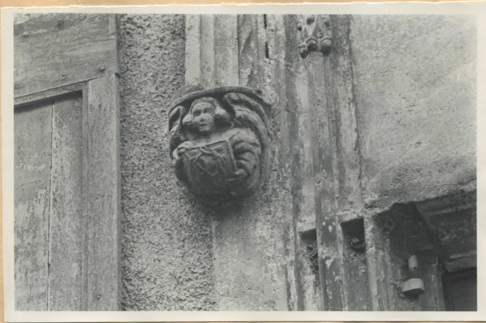
Fig.10: Demi-fenêtre sculptée, écusson de gauche.