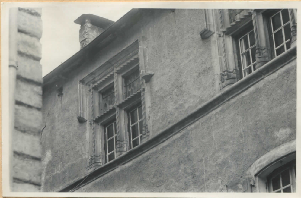
Fig.12: Façade sur la rue, 2ème étage, fenêtres (d-e, fig.1).