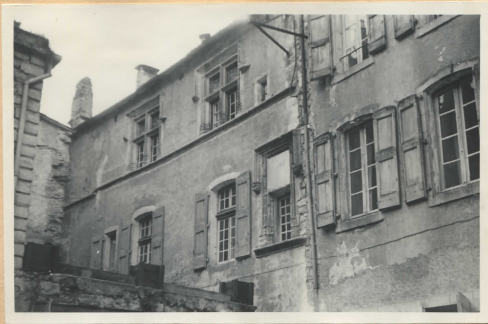
Fig.6: Façade sur la rue, partie droite, fenêtres anciennes.