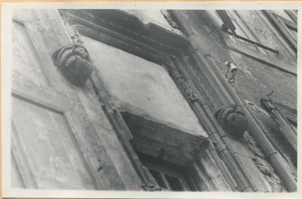
Fig.7: Façade sur la rue, 1er étage, demi-fenêtre sculptée.