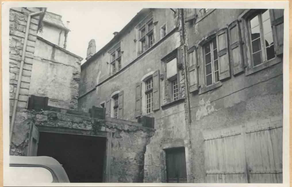
Fig.3: Façade sur la rue de la Ville