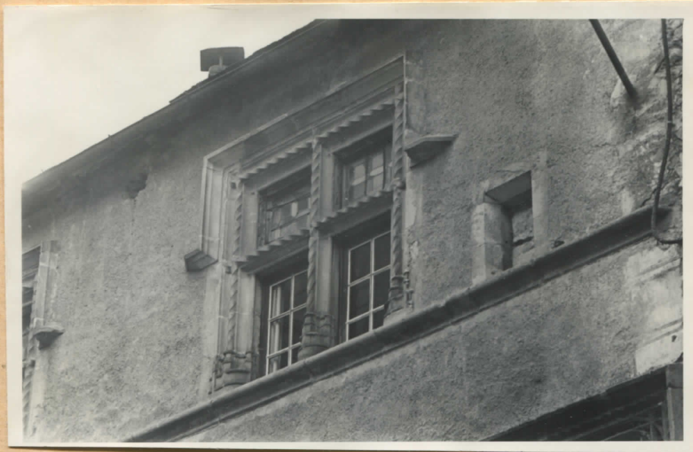
Fig.14 et 15: Façade sur rue, 2ème étage, fenêtre de droite (e, fig.1).