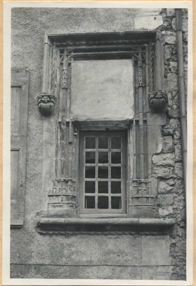
Fig.8 et 9: Façade sur rue, 1er étage, demi-fenêtre sculptée.