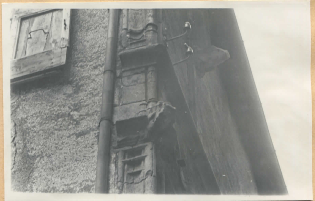
Fig.5: Angle des façades, détail.