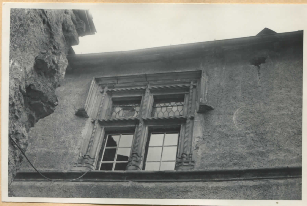
Fig.13: Façade sur rue, 2ème étage, fenêtre de gauche (d, fig.1).