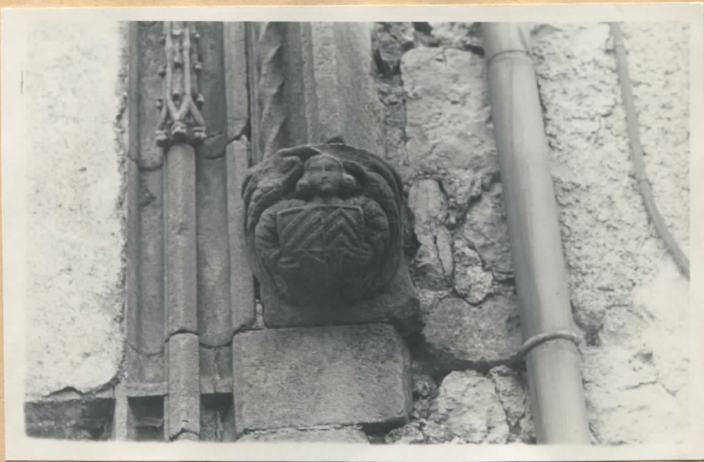
Fig.11: Demi-fenêtre sculptée, écusson de droite.