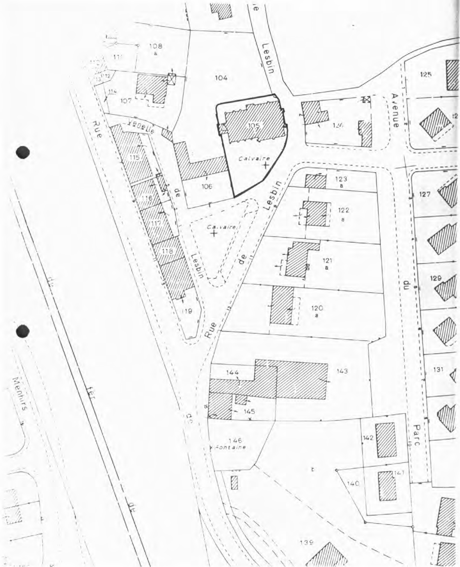
Pl. I Plan de situation. Extrait cadastral 1986, section AB, échelle 1/1000°.