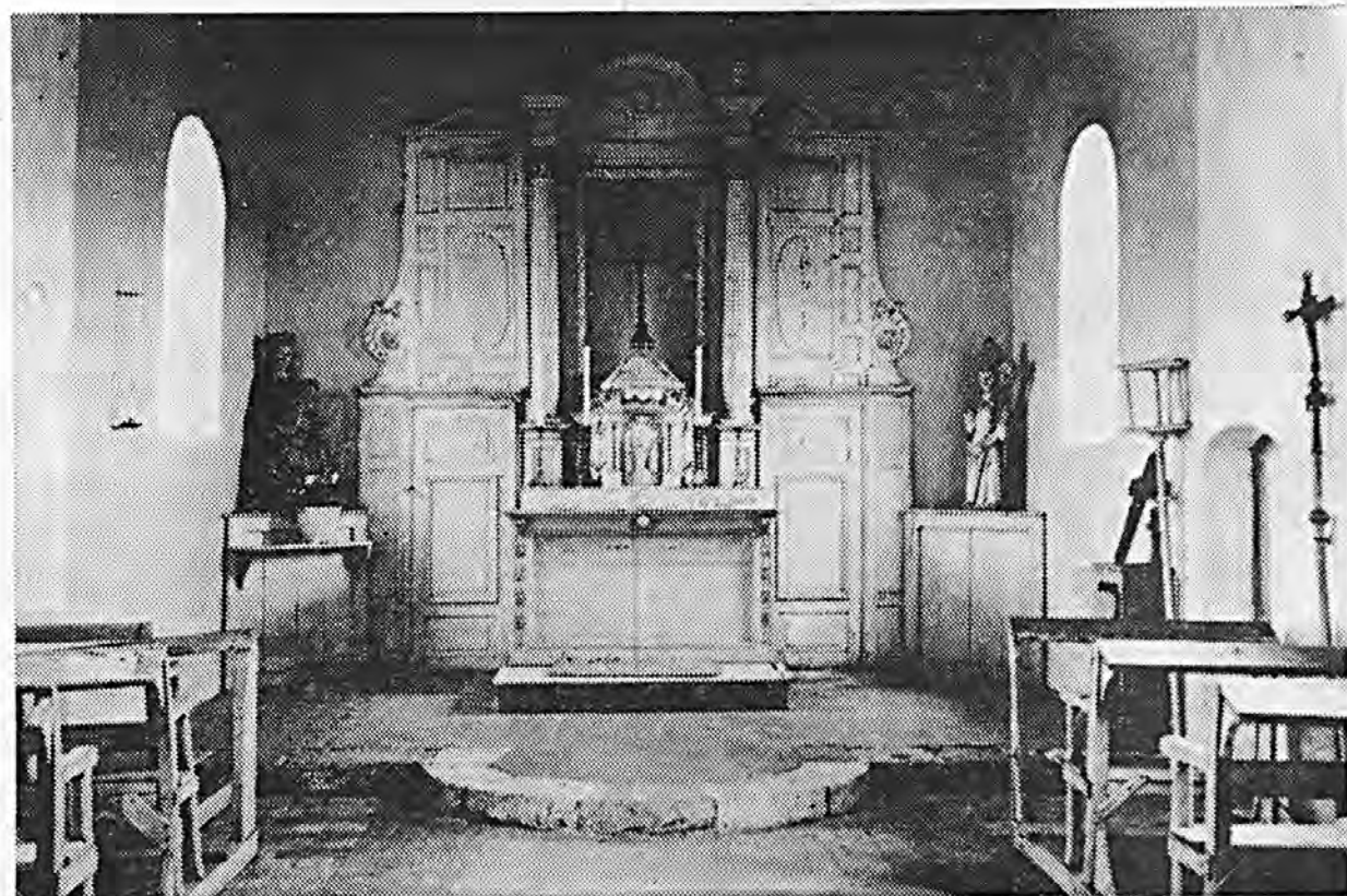
JOCHES : Intérieur de l'Eglise