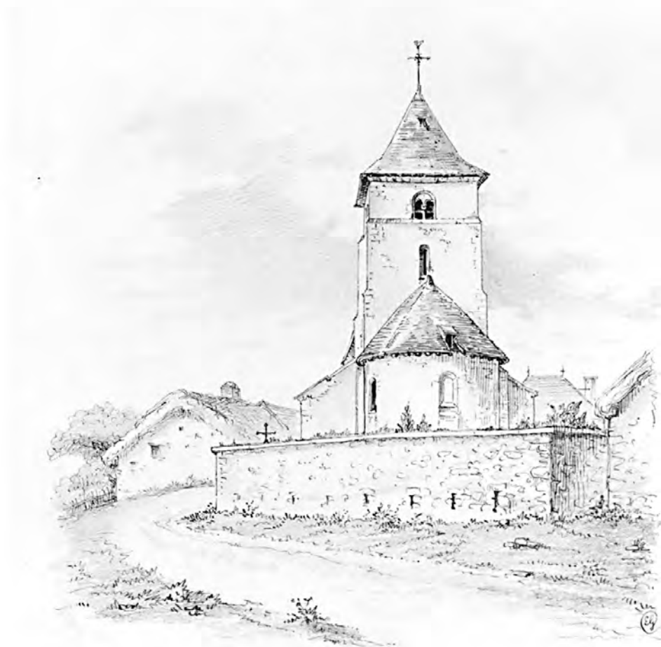
Eglise de COIZARD, Canton de Montmort.