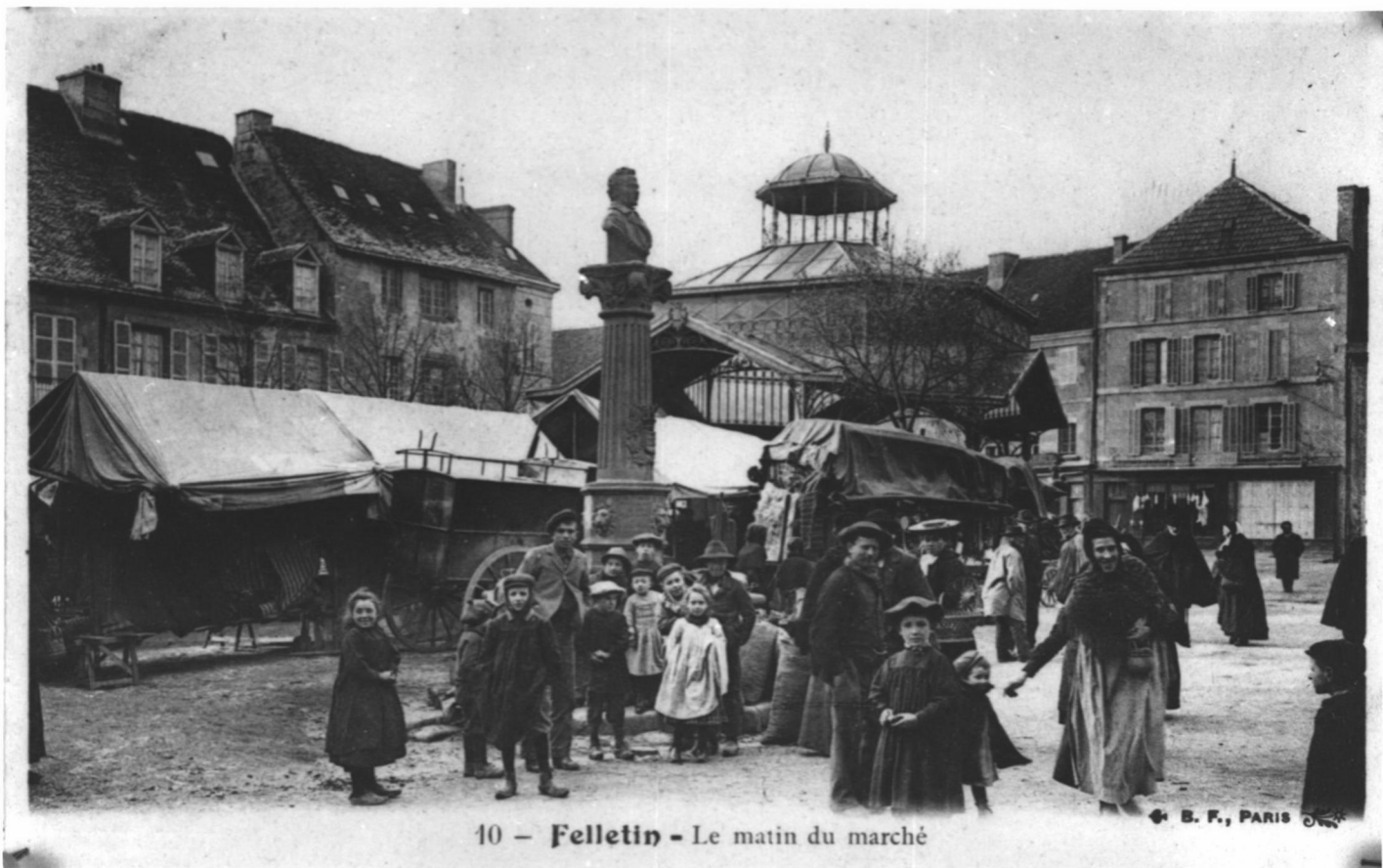
10 - Felletin - Le matin du marché