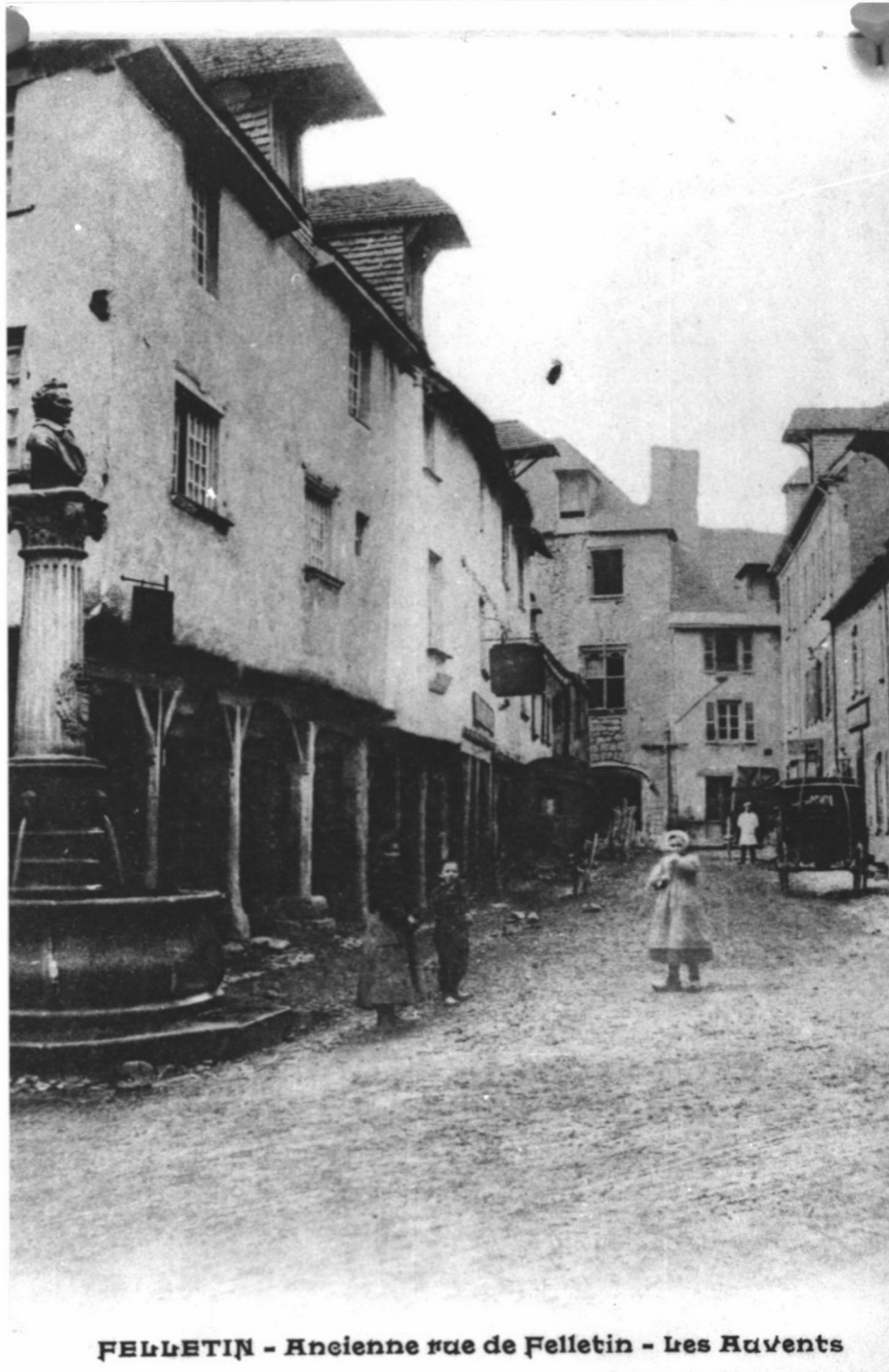
FELLETIN - Ancienne rue de Felletin - Les Auvents