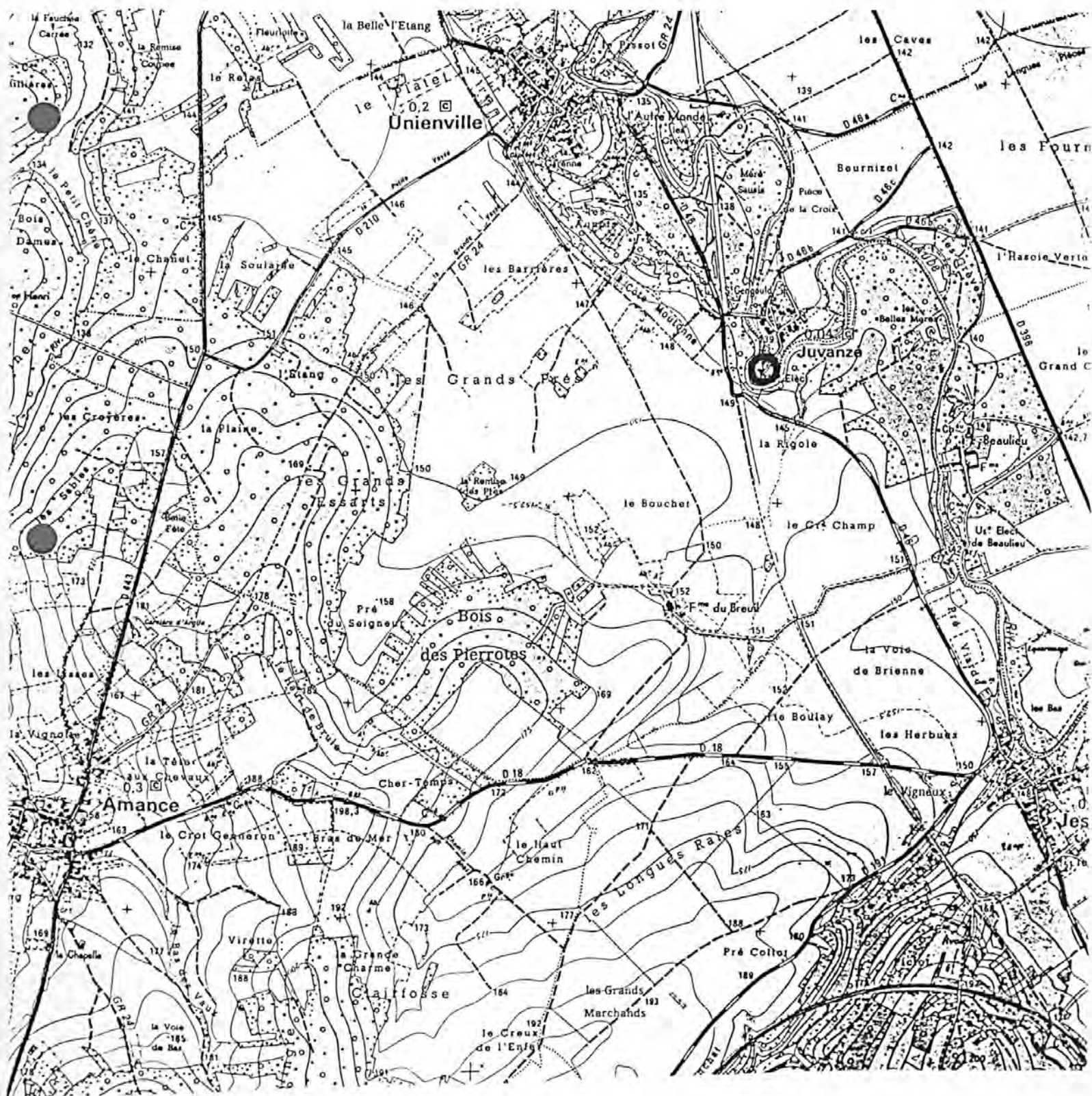
Pl. I : Carte de localisation de l'oeuvre Carte topographique, I.G.N., 1977, 1/25 000e Brienne-le-Château, 2917 est